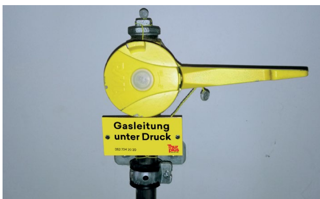
Verzapfte Hausanschlussleitung im Haus

Der Gasanschluss wird unmittelbar beim Gebäudeeintritt nach dem Haupt- absperrventil verzapft und mit einem Warnhinweis versehen. In regelmässigen Abständen überprüft Thurplus die Verzapfung, um Sicherheitsmängel rechtzeitig zu erkennen.